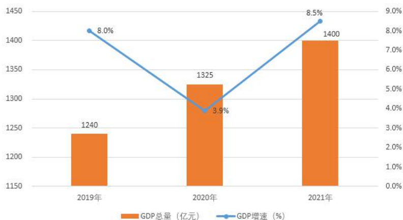
图 1：2019-2021 年江北区 GDP 总量与增速情况

业提质增效，以海尔为核心的电子电器产业，逐步实现传统低端产品向中高端智能化迈进。持续推动智能化改造，累计启动 70 余个智能化改造项目，海尔 COSMOPlat 引领构建工业互联网生态圈；迈基诺基因、斯德姆干细胞、康巨全弘等生物医药重点项目加快布局，智飞生物研制出全球首个获批临床使用的重组亚单位蛋白新冠疫苗，生物医药营业收入预计实现 220 亿元，同比增长 57%。